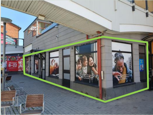
Vy mot ICA