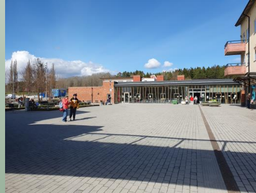
Bakre torget mot Brohuset