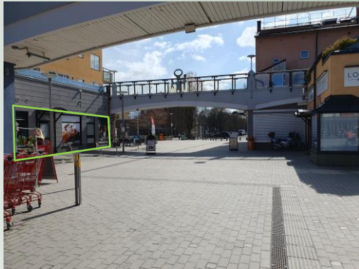
Vy mot parkeringen