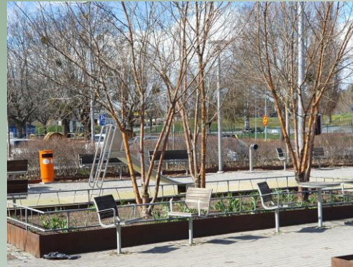
Lekplats och sittplatser i centrumet