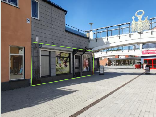
Vy mot bakre torget