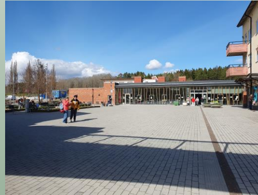
Bakre torget mot Brohuset