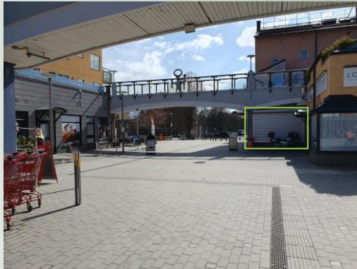
Vy mot parkeringen