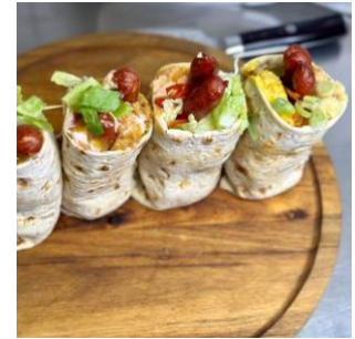
Världskända tunnbrödrullar från Brogrillen