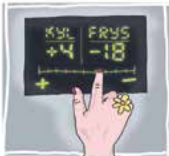
Illustration: Anna Windborne.

Ställ in rätt temperatur i kyl och frys. Rekommenderade temperaturer är +4 grader i kylan och -18 grader i frysen. För varje extra grad av nedkyllning ökar energianvändningen med upp emot 10 procent.