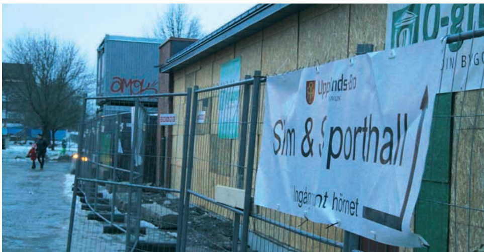
Brohuset är idag en byggarbetsplats, men trots det lyckas man hålla sim- och sporthall öppna.