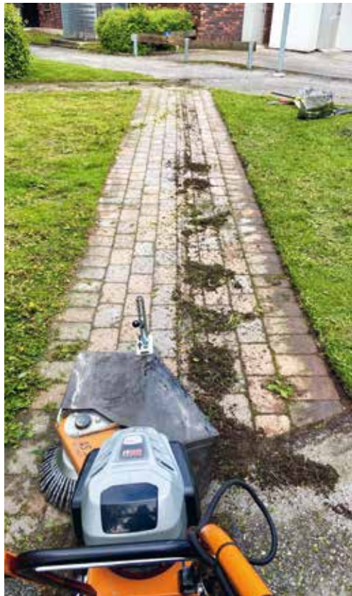
Vår nya miljövänliga ogräsmaskin som går på uppladdningsbart batteri.